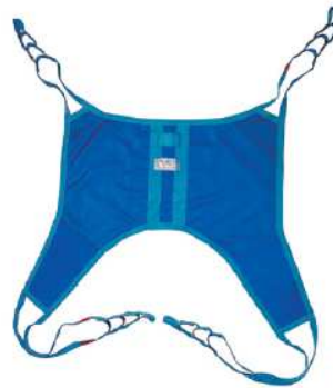
スリングローバック・スタンダード