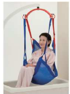
入浴用シート パオ メッシュブルー (ハーフサイズ)